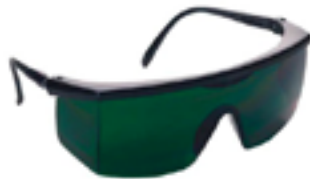
Óculos de segurança com lente em policarbonato verde ou cinza