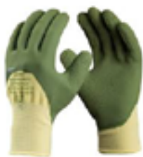
Luva de segurança em Nylon, recoberto ¾ ou total com banho látex corrugado