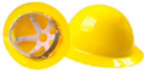
Capacete de segurança Tipo 1