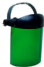
Protetor facial composto de um visor em policarbonato com proteção UV