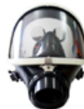
Respirador facial inteira com manutenção