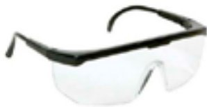
Óculos de segurança c/ lente em policarbonato incolor com tratamento antirrisco