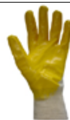
Luva de segurança em tecido de algodão com banho nitrílico