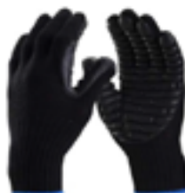
Luva de segurança algodão, com gomos de cloro neoprene na palma e dedos