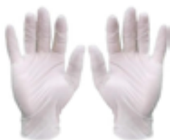
Luva de procedimento em látex natural (c/s talco) ou nitrílica (s/ talco)