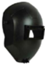
Máscara de solda confeccionada em Polipropileno ou Celeron