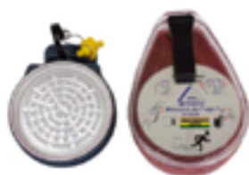
Respirador de fuga