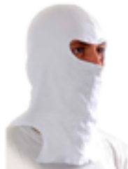
Capuz de segurança em lã, suedine ou brim