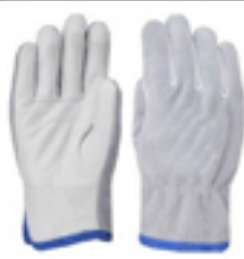
Luva de segurança em raspa e vaqueta