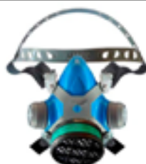
Respirador semifacial com manutenção