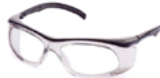
Óculos de segurança confeccionado em termoplástico