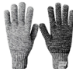
Luva de segurança tricotada em fibras sintéticas