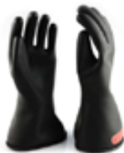
Luva de segurança isolante em borracha.