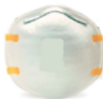
Respirador semifacial sem manutenção PFF2