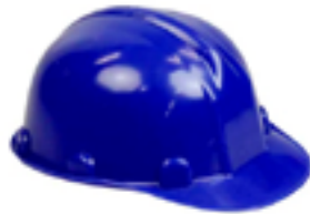
Capacete de segurança Tipo 2