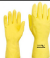
Luva de segurança em látex natural, com ou sem revestimento interno.