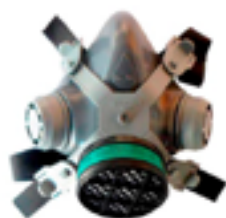
Respirador 1/2 facial com manutenção