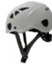
Capacete de segurança Tipo 3