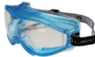
Óculos de segurança ampla visão confeccionado em material termoplástico