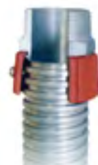
TA-20 M Para ELOFLEX