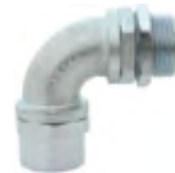
CMFC-900 Conector macho fixo curvo 90°