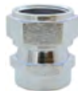
CFGR-180 Conector fêmea giratória reta