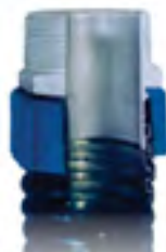
TA-30 M Para INDEFLEX