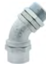
CMFC-450 Conector macho fixo curvo 45°