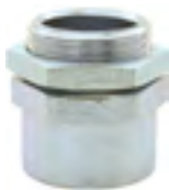
CMFR-180 Conector macho fixo reto

Convencionais em latão zincado de 3/8" à 4", roscas BSP ou NPT