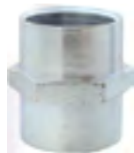
CFFR-180 Conector fêmea fixa reta