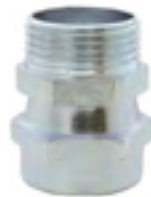
CMGR-180 Conector macho giratório reto